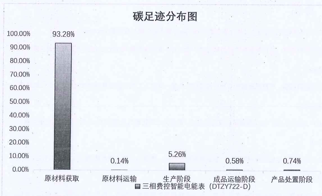
图 5.2.1.2 三相费控智能电能表 (DTZY722-D) 生命周期阶段碳排放分布图