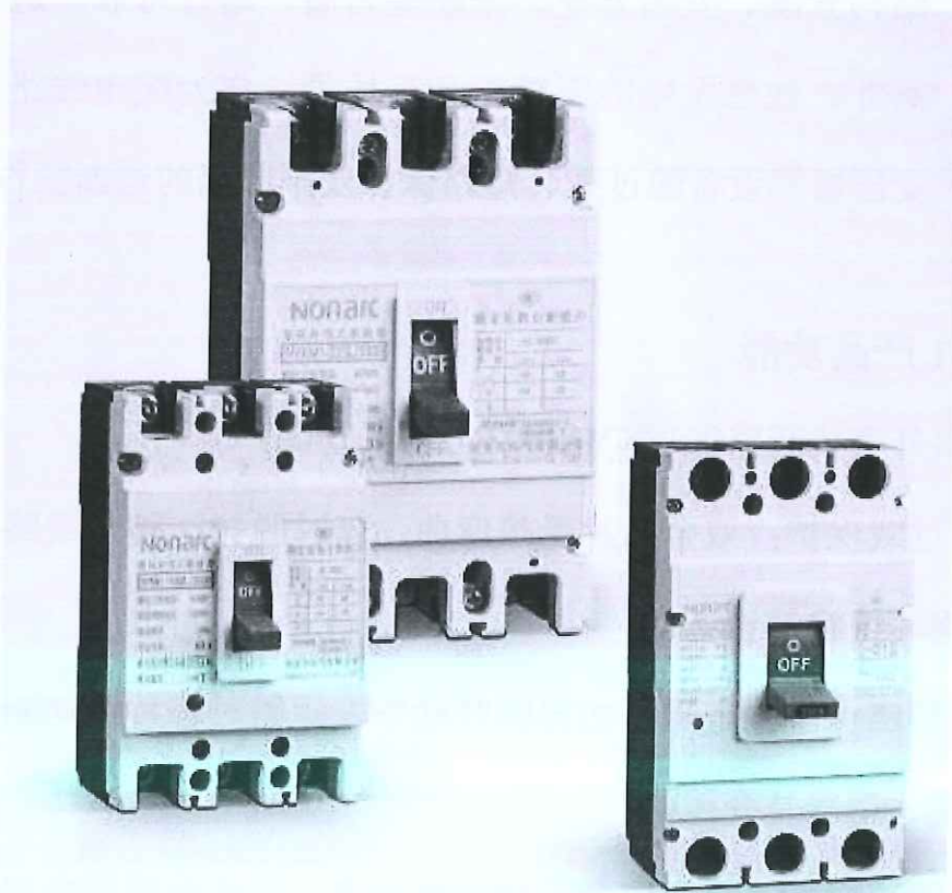
塑料外壳式断路器（NYKM1E-250）