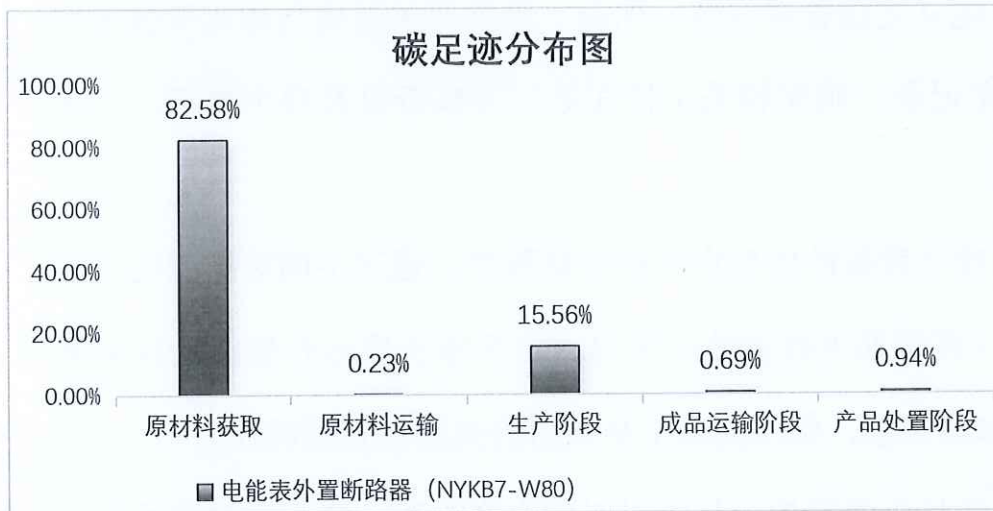
图 5.2.1.2 电能表外置断路器 (NYKB7-W80) 生命周期阶段碳排放分布图