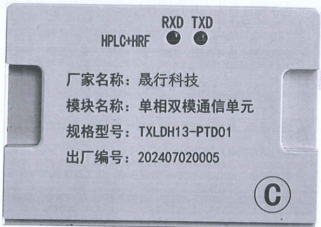
通信单元（单相/双模/2020版智能电能表）（TXLDH13-PT01）