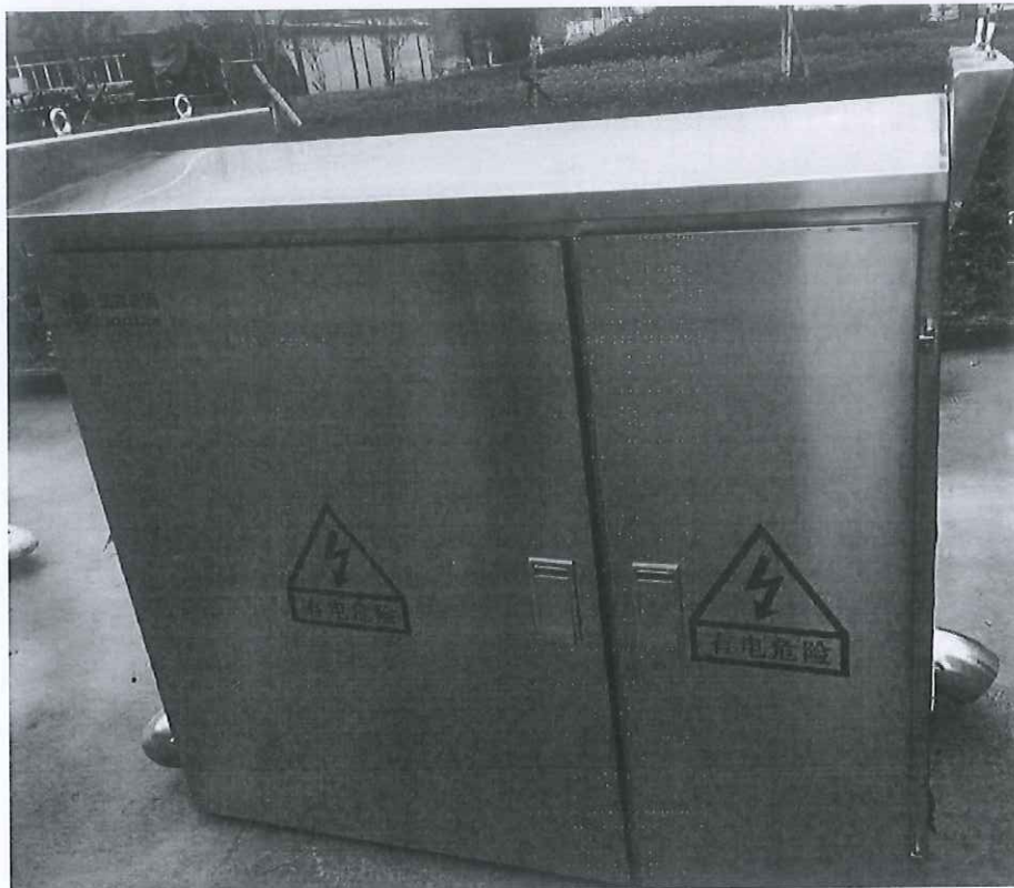
智能综合配电箱（低压成套开关设备）（JP）