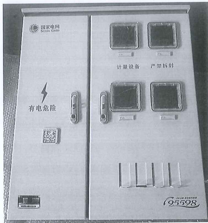
三相多表位计量箱（配电板）（BXS2）